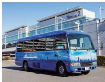
ホテルマイステイズ羽田行き to HOTEL MYSTAYS Haneda

Please take Blue bus to HOTEL MYSTAYS Haneda, and White bus to HOTEL MYSTAYS PREMIER Omori. No transfer provided between these two destinations.