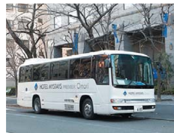
ホテルマイステイズプレミア大森行き to HOTEL MYSTAYS PREMIER Omori

※先着順となり、ご予約制ではございません。皆さまお揃いになられてから、列にお並びください。