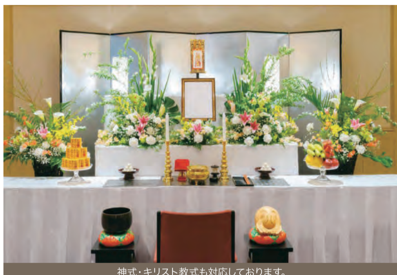
神式・キリスト教式も対応しております。

ありし日への想い。忘れ得ぬ出来事。 故人とご縁のある方々が集まり懐かしい思い出を語り合う 大切なひと時を、真心こめてお手伝いいたします。