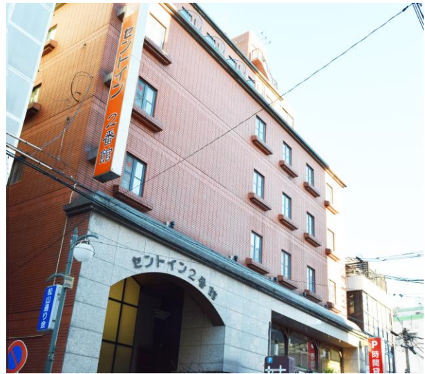
セントイン2番館(外観)

ホテルセントコスモは、セミダブルからツインまで数種類の客室から広さをご選択いただけます。館内の多目的ホールは宴会や会議、セミナー、試験会場など用途は多彩。最大200名様まで収容可能で、ご利用人数に合わせて合計5会場ございます。さらに、ご宿泊のお客様が利用可能なコインランドリー、30台収容可能な駐車場も備えております(高さ制限あり)。また、セントイン2番館は、セミダブルからツインまで落ち着いた雰囲気のお客室をご用意。57台収容可能な駐車場もございます。