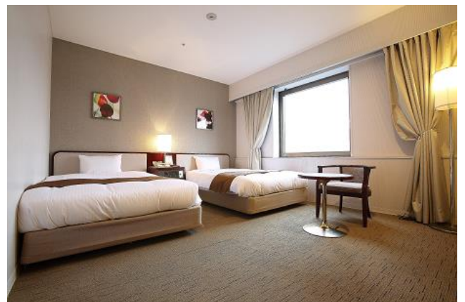
ホテルセントコスモ(客室)