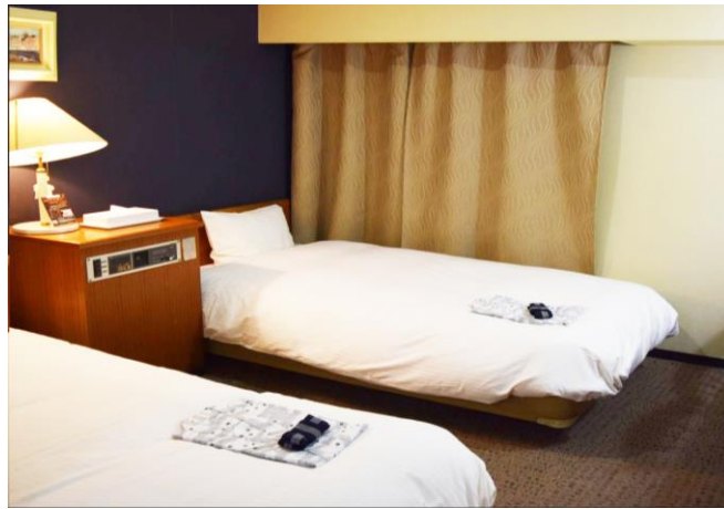
セントイン2番館（客室）