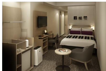
コンフォートダブル（イメージ）