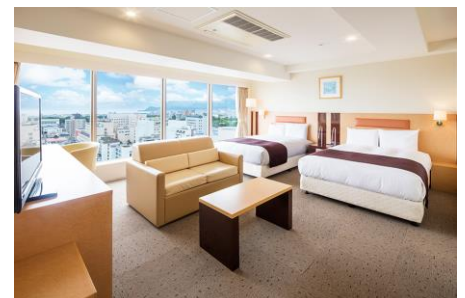
デラックスツインルーム