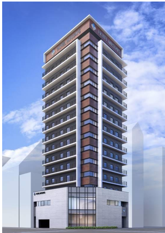
ホテルマイステイズ御堂筋本町 外観