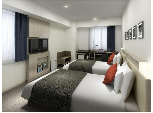
スタンダードツイン