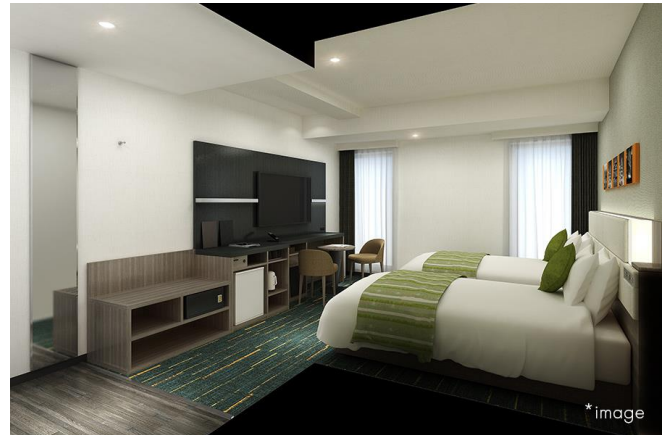
ツインルーム（イメージ）