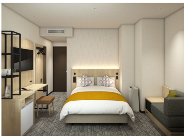
スタンダードダブル